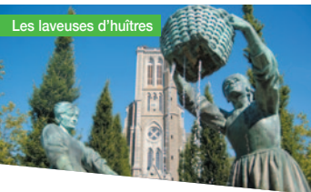
Les laveuses d'huîtres

Balisage Cancale Très facile 16 km 218m Dénivelé