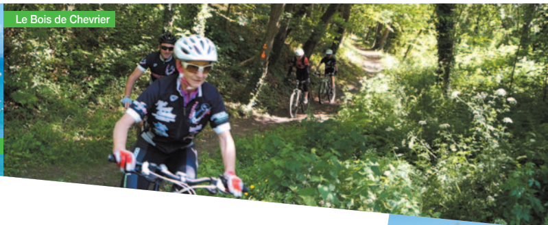
Le Bois de Chevrier