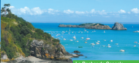
Le Rocher de Cancale