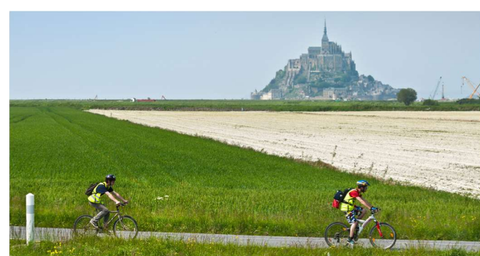
Baie du Mont-Saint-Michel