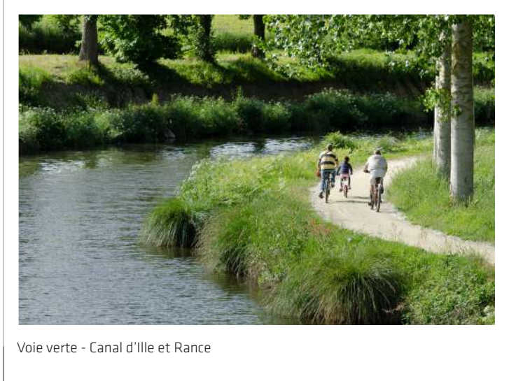
Voie verte - Canal d'Ille et Rance