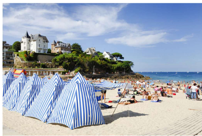
Plage de l'Écluse - Dinard

Ce joli circuit démarre Place de la Mairie à Saint-Jouan-des-Guérets. Il vous emmène sur les bords de Rance et offre de beaux points de vue sur les îles Harteau et Chevert. Un arrêt s'impose à la Malouinière du Bosq (privée) dont les jardins se visitent en saison. De belles chaumières restaurées se découvrent aussi au fil de la balade. Le village de Saint-Père-Marc en Poulet invite à une halte sur la place de l'église. Le retour vous entraîne vers les anciens moulins à marée de Beauchet et de Quinard.