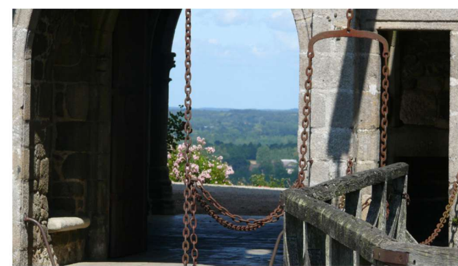
Château de Montmuran

Le parcours se déroule dans la contrée où Bertrand Duguesclin fut armé chevalier de Tinténiac en 1354. Au départ de Tinténiac, dont le bourg possède un patrimoine architectural remarquable et très riche, vous serez enchantés par la diversité des paysages traversés : canal d'Ille-et-Rance, écluses et maisons éclairées, panorama sur la plaine de Tinténiac, des hauts de Hédé, églises, manoirs et châteaux. À voir absolument : le château de Montmuran et ses deux ponts-levis tels que les a connus Duguesclin.