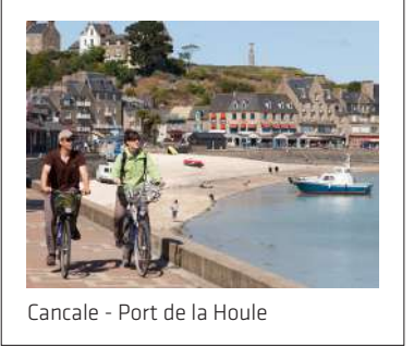
Cancale - Port de la Houle