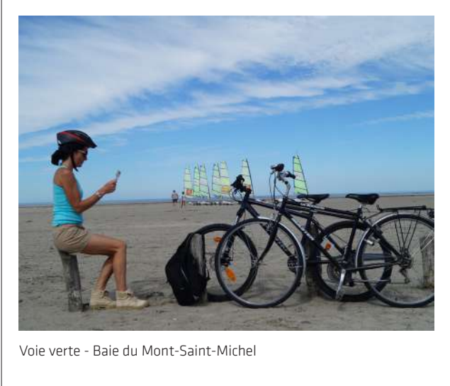
Voie verte - Baie du Mont-Saint-Michel