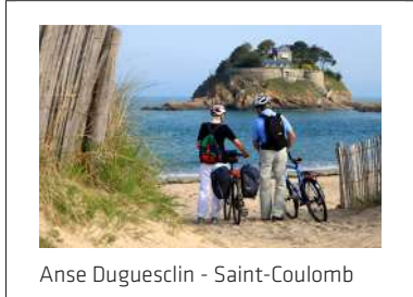
Anse Duguesclin - Saint-Coulomb