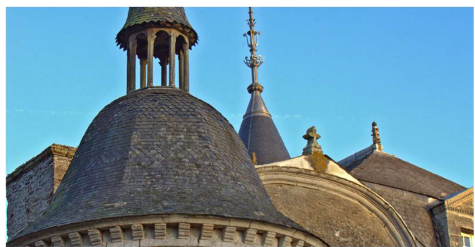
Château de la Bourbansais

La boucle présente de belles demeures, témoins de la richesse patrimoniale de la région. Au départ de Saint-Domineuc, après avoir flâné sur les berges du canal, de jolies maisons en terre jalonnent votre itinéraire. Tréverien est une escale sur le canal avec ses berges aménagées. Pour les moins courageux, une liaison intermédiaire permet de rejoindre directement le point de départ en suivant la voie verte le long du canal d'Ille-et-Rance. Vous rejoindrez enfin Pleugueneuc, où le Domaine de La Bourbansais fera le bonheur des petits et des grands !